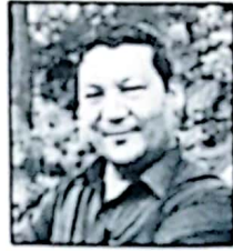
कृष्ण किंसी सचिव